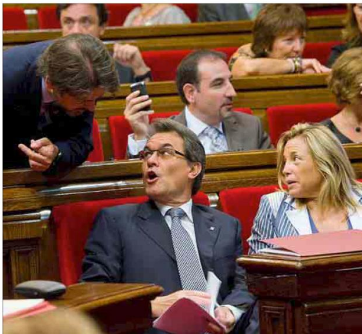
Artur Mas habla con Oriol Pujol durante el debate sobre el pacto fiscal celebrado ayer en el Parlament.